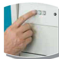
Nyomogombok a Simple változatnál